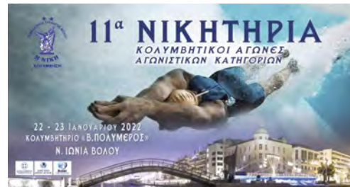
Αφίσα - Banner