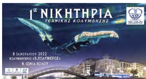
Αφίσα - Banner